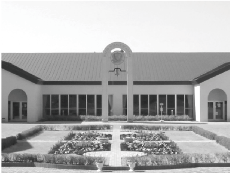
幸福の科学学園 希望の鐘